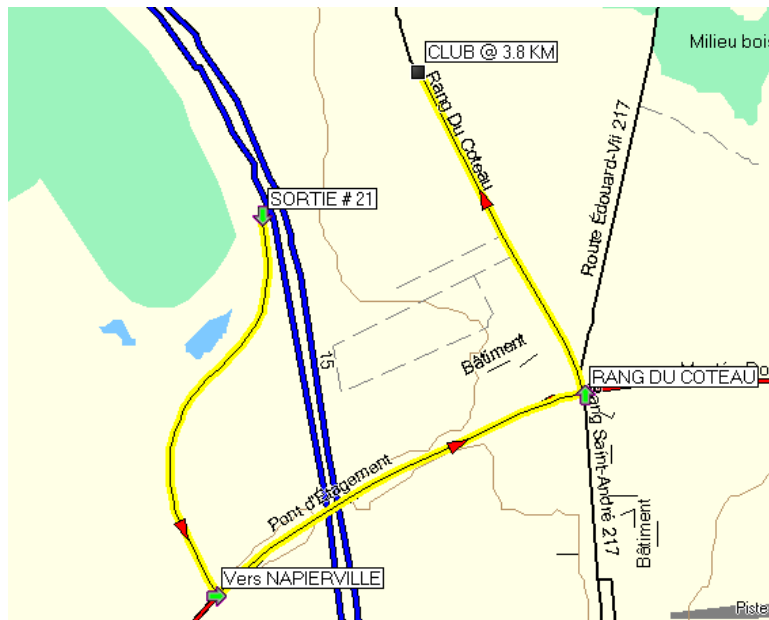
La carte n'est pas à l'échelle

De Montréal, prendre A-15 sud vers Plattsburgh, jusqu'à la sortie #21; Prenez la bretelle de sortie et tournez à gauche sur Rang Sainte-Marguerite R-219 / 221; roulez sur 0.6Km puis tournez à gauche après Motel-Restaurant OASIS et serrez à gauche pour prendre Rang Du Coteau ; le Club de tir est à 3.8 Km à votre gauche au 574 rang du Coteau.